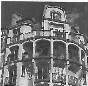
Louer un meublé à Paris est plus cher au m 2 qu'une location nue.

La hausse de 0,17 % entre les quatrième trimestres 2011 et 2012 des loyers des meublés parisiens reste sage, inférieure à celle de l'indice de référence des loyers (IRL), entre 1,88 % et 2,24 % selon le trimestre, d'après l'Observatoire des loyers Clameur. Mais le prix moyen au mètre carré est de 35,79 euros en meublé, contre 22,90 euros en location nue.